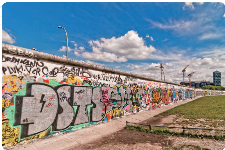
✦ 柏林圍牆（Berliner Mauer）