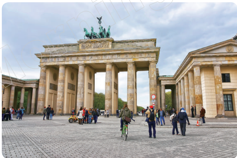
✦ 布蘭登堡門（Brandenburger Tor），位於柏林（Berlin）