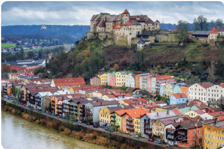
✦ 布格豪森（Burghausen），位於巴伐利亞邦的一個市鎮