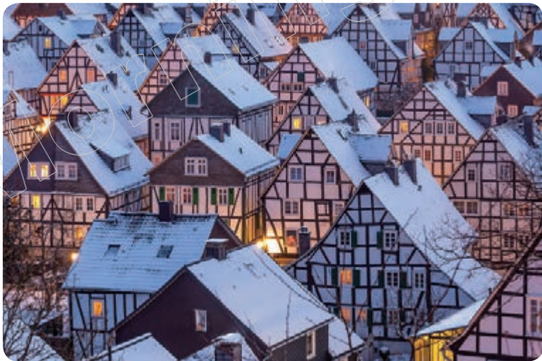
✦ 弗羅伊登貝格（Freudenberg），位於北萊茵—西發利亞邦（Nordrhein-Westfalen）