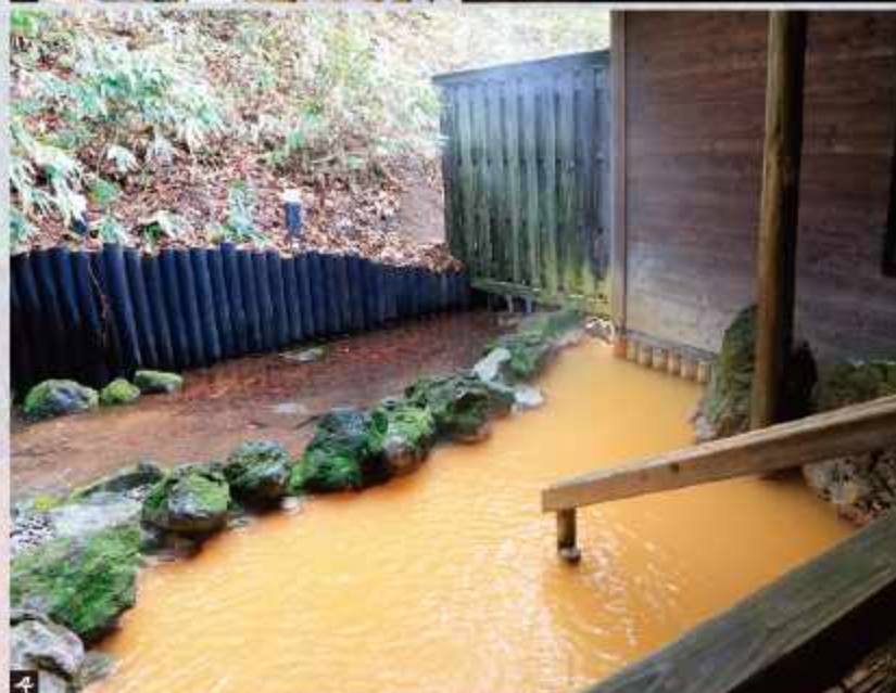
1.妙乃湯外觀 / 2.銀湯混浴露天風呂 / 3.金湯混浴露天風呂 / 4.男性露天風呂