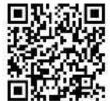
東北地區五日券 JR東日本+南北海道 JR東北+南北海道