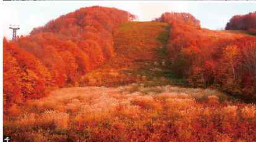
1.山麓駅 / 2.秋末冬初的山頂公園駅 / 3.冬季山頂公園駅有驚人結冰現象 / 4.秋天搭纜車能看到一片楓紅