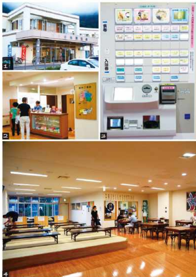
1.谷地頭溫泉外觀 / 2.櫃檯能購買盥洗用具 / 3.無論入浴或用餐記得要先購券 / 4.休息用餐的空間寬敞

來 到函館，如果因為預算無法住到溫泉旅館，那不如考慮一下，到當地居民也會利用的溫泉浴場享受吧！從路面電車站徒步7分鐘的谷地頭溫泉，2013年才重新改裝完成，除了原本的大浴場及露天風呂外，還增加了「サウナ」(蒸氣浴)跟食堂，以CP值而言是相當划算，更衣室裡還有免費附鎖的置物櫃可以使用，泡完溫泉後來罐冰涼的咖啡牛奶是最棒的事情了！但價格只是入場費，要記得自行攜帶毛巾、沐浴乳、洗髮精等盥洗用具，或是可在櫃檯另外購買。