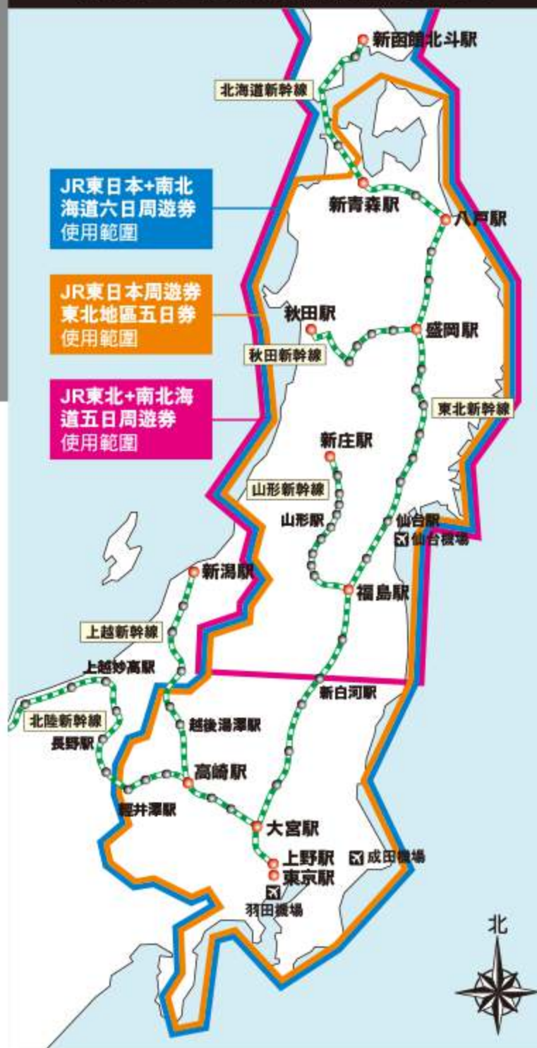
東北地區交通票券使用範圍圖

從青森跨海到函館的渡輪航線有兩條，一條是從青森到函館、一條是從大間到函館，不過對一般自助旅行者來說，除非行程有計畫到下北半島，否則最佳選擇應該還是青森函館這條航線，從青森駅、新青森駅都有巴士可以前往津輕海峽フェリーターミナル。