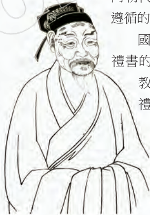
明萬曆年間《程朱闕里志》朱熹像 / 改繪

國家除了重要的官修禮典外，也有許多民間禮書的編訂問世，特別是宋代以後，隨著民間禮教的越加強化，湧現了大量的「家禮」、「鄉禮」類著述，其中較重要的如北宋司馬光的《書儀》、南宋朱熹的《家禮》、明代黃佐的《泰泉鄉禮》等。這些由士大夫個人擬定的儀制和日常行為規範，或補充了國家禮制的不足，或將國家禮制的部分內容通俗化、普及化，使之更易於為民眾所接受，也更易於操作，後來為