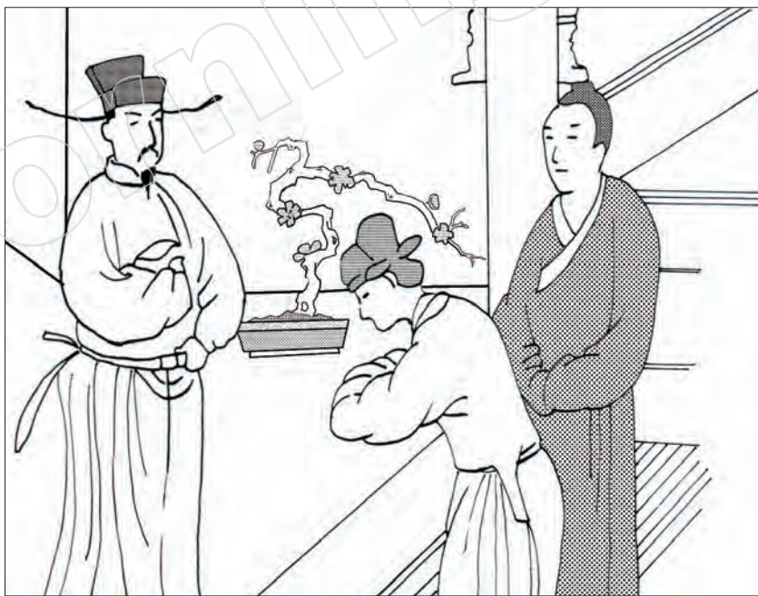
中國古代盛行「五禮」中的「賓禮」迎賓 / 改繪