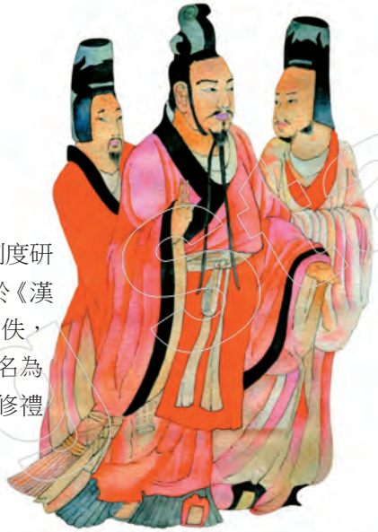
大唐《開元禮》中規定四方蕃主朝見天子時需服其國服 / 改繪

中國是個禮樂和禮治教化甚深的文化國度，根據楊志剛先生在《中國禮儀制度研究》中指出：官修禮典始於漢代，最早見於《漢禮》（一稱《新禮》），但《漢禮》不幸亡佚，西晉接續了這個傳統，裁成「國典」，名為《晉禮》或《新禮》。南北朝發展了官修禮典的傳統，而現存最早的國家禮典是唐代的《開元禮》。留存至今重要的「國典」，還有宋代的《太常因革禮》、《政和五禮新儀》、《明集禮》、《清通禮》等。 1 這些國家禮典相當程度地反映了不