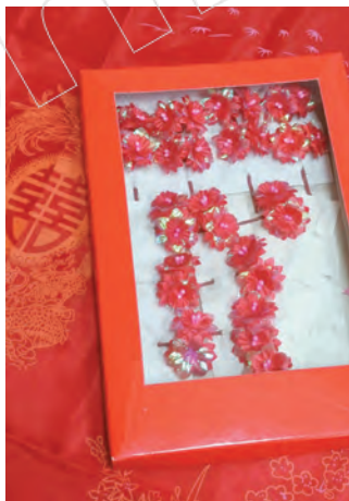
新娘的婚嫁飾品「春仔花」