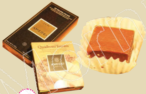
P.92 巧克力 ：都靈的榛果巧克力、Amedei頂級巧克力及Perugina的Baci巧克力。