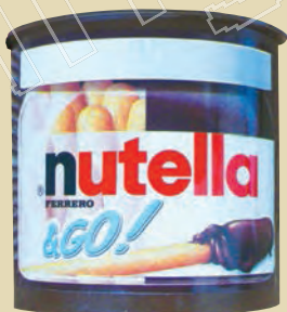
榛果醬 ：義大利小朋友最愛的榛果醬(Nutella)，帶回來送小朋友最適合了。