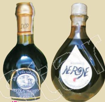
P.53 陳年酒醋 ：陳年好酒醋在義大利便宜很多，是健康又美味的伴手禮。