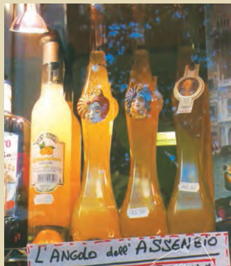
檸檬酒 ：南義盛產檸檬，並製成香醇美味的檸檬酒。