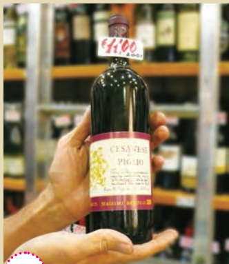
P.56 葡萄酒 ：義大利葡萄酒算是日常用品，品質佳、價格平實。