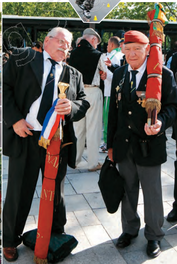
↑ 法國老兵來到巴黎凱旋門，參加滑鐵盧戰役紀念儀式 ← 巴黎小學生的戶外教學是參觀古蹟