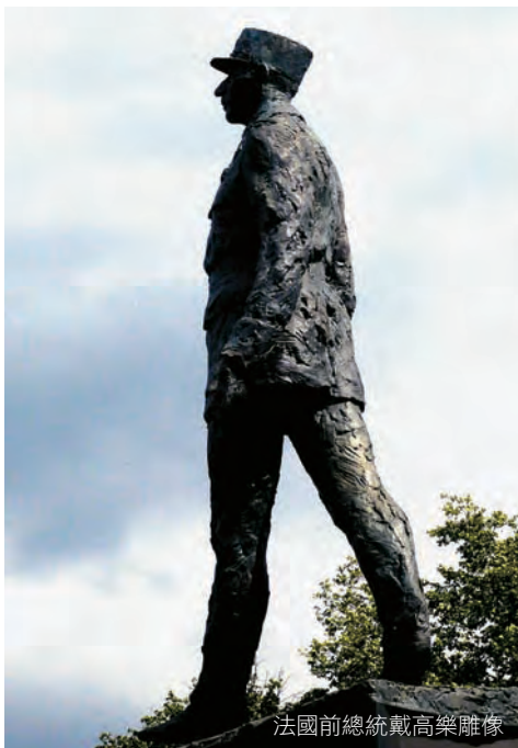
法國前總統戴高樂雕像

在法國近代史上，戴高樂(Charles de Gaulle)具有重要的影響地位，後來繼任的龐畢度(Pompidou)、季斯卡(d'Estaing)、密特朗(Mitterand)以及現任總統薩柯奇(Nicolas Sarkozy)等，都追隨他的獨立精神和發展經濟的方向，使得法國躍居歐洲列強之一。