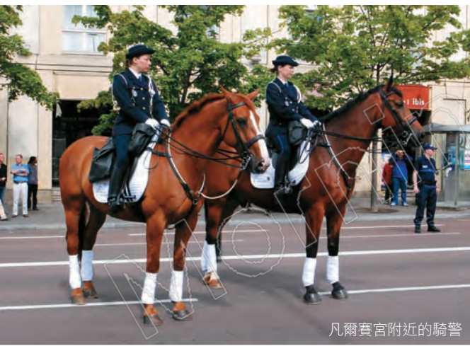
凡爾賽宮附近的騎警