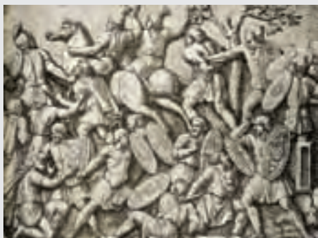
←阿拉里克進攻羅馬，美國《國家地理雜誌》插圖

西元395年，狄奧多西去世，羅馬帝國正式分為東、西兩部。此時常常抗拒羅馬命令的阿拉里克乘機起義，反羅馬的運動在帝國境內開始蔓延。從小亞細亞到馬其頓，從希臘半島到義大利半島，西哥德人在阿拉里克的率領下取得了無數次勝利。那些受羅馬帝國壓迫的農奴和農民，也踴躍加入阿拉里克的部隊，不斷壯大的隊伍為羅馬帝國帶來了逐日加劇的威脅。