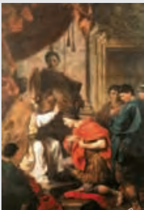
←狄奧多西一世受洗，1745年皮爾作品，義大利佩魯貴國立藝術館藏 狄奧多西一世在位時，將基督教定為羅馬帝國國教。畫面中坐著的是當時的教宗聖安布羅斯。

以形成有效的攻勢，後來遂與狄奧多西達成停戰協定：狄奧多西在多瑙河畔劃出一塊區域供西哥德人居住，西哥德人則向羅馬帝國提供兵源。