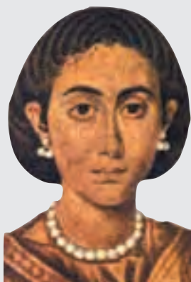
↑ 普拉西蒂亞肖像，壁畫（局部）

躊躇滿志的阿拉里克剛到義大利半島便不幸染病，一命嗚呼了。西哥德人隨即強迫羅馬俘虜排乾附近布辛特河的河水，把阿拉里克的遺體和大量殉葬品埋在河床下，最後又將河水放回河床。那些參與工程的羅馬俘虜事後全部遭滅，因此阿拉里克屍骨的具體位置至今仍是個謎。