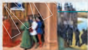
圖說：卡佩王朝建立初期，國王名義上是最高君主，但實際上王權薄弱，法國分屬許多公國和伯國。

卡佩王朝建立初期，王權的本質很薄弱，在名義上國王是最高君主，國王職位的世襲自為他帶來地位，是神授統治權的君王，但事實上並非如此。當時的法國分屬許多公國和伯國，並擁有佛蘭德、布汶、西芒斯等諸侯國。西