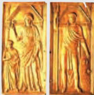
↑ 斯提利哥和他的妻兒，羅馬時期黃金製作

斯提利哥解米蘭之圍後，並未得到應有的榮譽，反而受到羅馬貴族的詆毀。貴族們開始攻擊斯提利哥，誣陷他私下與阿拉里克勾結，並準備立自己的兒子為皇帝。甚至斯提利哥籌備軍餉時，也被誣陷為擴充自己的勢力，意圖取代羅馬政府。西元408年8月23日，斯提利哥以莫須有的罪名被處死，並株連九族。斯提利哥死後，那些誓死保衛羅馬的「蠻族」也紛紛出城投靠阿拉里克。保衛羅馬的最後一絲力量讓羅馬人自己給消滅了。