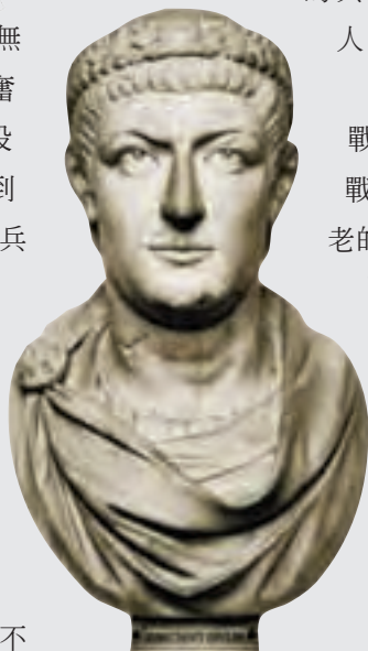
← 瓦倫斯雕像，羅馬帝國後期作品 瓦倫斯是羅馬分治時東羅馬的皇帝，在阿德里亞堡戰役中戰死。

在阿德里亞堡戰役中，騎兵成了戰場上的主角，古老的方陣和軍團戰術已失去了優勢，羅馬帝國從此走向衰落。