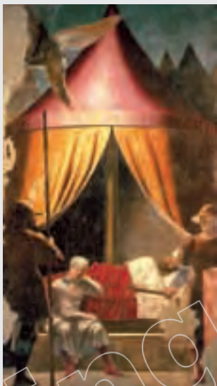
←君士坦丁大帝的夢想，皮耶羅·弗朗切斯卡作品 君士坦丁一世是羅馬帝國後期最傑出的君主，即使在夢中也考慮著對衰落的帝國進行改革。

戴克里先擴大羅馬皇帝的權力，採用「多米那斯」稱號，仿效東方專制君主的宮廷禮儀。戴克里先改革後，行省被劃小，由四十多個增到一百個；行省中的軍權和行政權分開，軍隊中「蠻族」成員不斷增加；統一稅制，確定了新鑄幣含金、銀的標準；對基督教採取高壓政策，禁止舉行禮拜，清除軍隊和官員中的教徒，沒收教會財產，拆毀教堂，焚燒經書，逮捕神職人員，處死一些教徒。戴克里先的改革，使面臨嚴重危機的羅馬帝國獲得了暫時的穩定。