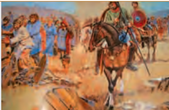
↑ 哥德人渡過多瑙河