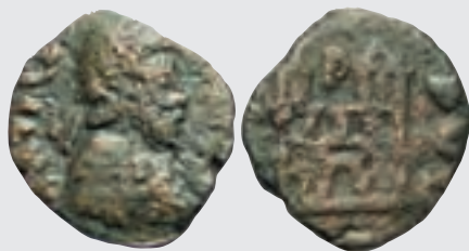
↑ 法侖提尼安三世時期的貨幣

魯道夫心知肚明，於是故意刺激君士坦提亞斯，選個黃道吉日與普拉西蒂亞在軍旅中成婚了。君士坦提亞斯立即派艦隊封鎖高盧港口，切斷魯道夫的糧