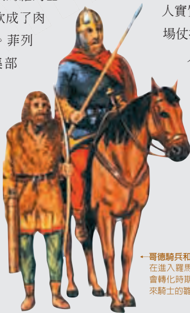
← 哥德騎兵和其僕人，想像圖

正與波斯人作戰的瓦倫斯聽說西哥德人造反，大為惱怒，與波斯人草草簽下停戰協議，立即回國進行鎮壓。但西哥德人已非十年前那般落後的狀態，他們從羅馬人那裡學到了許多東西，而部分羅馬逃兵也提供了西哥德人實質協助。因此瓦倫斯這場仗打得格外艱難，西哥德人僅用「車城」這一戰術，就教瓦倫斯的幾員大將一籌莫展。羅馬士兵士氣低落，抱怨聲日益高漲，瓦倫斯急需一場大戰以振奮軍心。