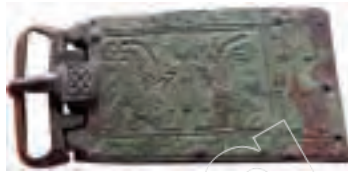
墨洛溫王朝時的青銅帶扣

羅馬帝國的解體 / 法蘭克王國的興衰 / 西歐封建化進程 / 基督教籠罩下的歐洲 / 拜占庭帝國 / 諾曼人狂飆掃歐洲 / 東南歐及東歐封建諸國 / 俄羅斯帝國的崛起 / 西亞穆斯林帝國 / 中世紀的南亞和東亞 / 中世紀的非洲 / 十六世紀以前的美洲 / 探險家的新航路 / 宗教改革和日耳曼農民戰爭